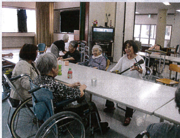
ご家族の面会にてお茶会