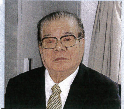
社会福祉法人 愛誠会

私共は、地域全体を社会福祉の基盤と考え、医療・保健と連携しながら、社会福祉の充実のための未来社会を築きます。