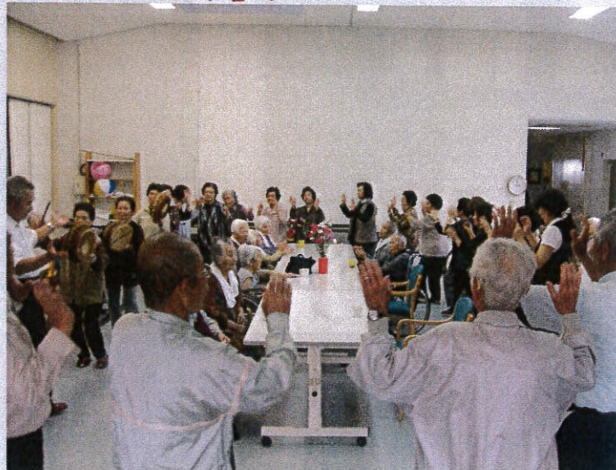
老人クラブとの交流会