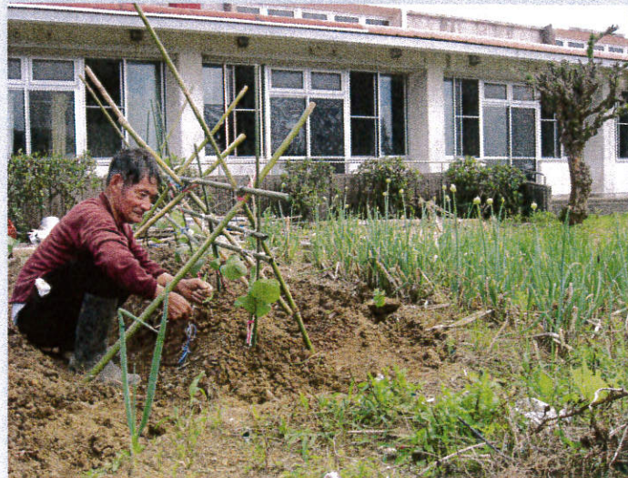
裏の畑で野菜作り